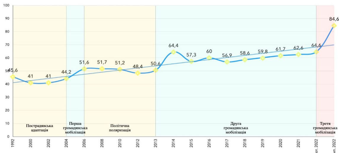
Рис. 2. Динаміка становлення громадянської ідентичності населення України [9]

Отже, національною ідентичністю є усвідомлення людиною власної приналежності до певної нації і держави, соціуму, культурних традицій, цінностей, психології, віри