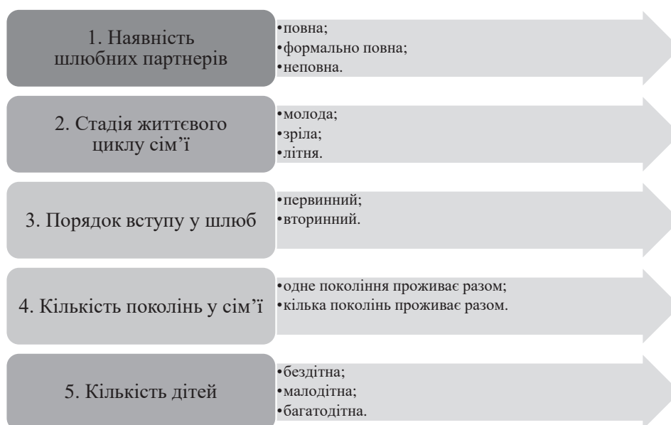
Рис. 2. Структура сучасних сімей [складено автором]

Функції сучасної сім'ї значно розширилися, нині до них відносяться такі: