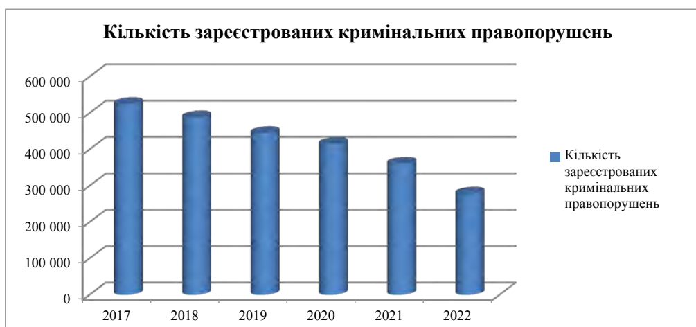
Графік 1. Кількість зареєстрованих кримінальних правопорушень (2017–2022 рр.)

До того ж щодо рівня злочинності у 2022 році, то за інформацією начальника Департаменту карного розшуку