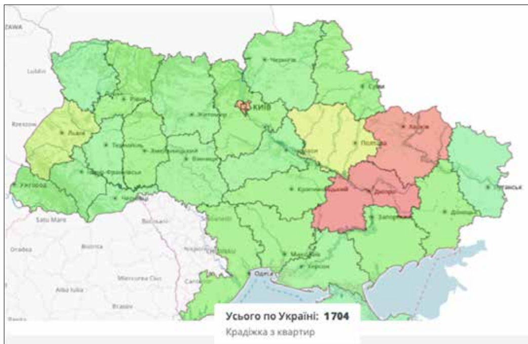
Рис. 3. Показник крадіжок з квартир по регіонах України за січень-жовтень 2024 р.

Джерело: ілюстрація з відкритих джерел, за матеріалами офіційного сайту Офісу Генерального прокурора – https://erdr-map.gp.gov.ua/csp/map/index.html#/map