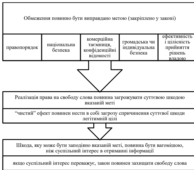
Рис. 2. Алгоритм формування висновку щодо обмеження свободи слова