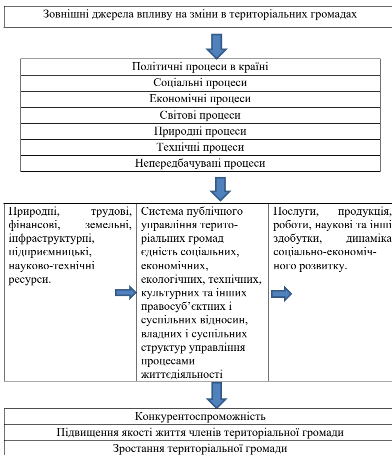
Мал. 1. Модель територіальної громади як об'єкта дослідження публічного управління в місцевому самоврядуванні.

Як продукт децентралізації, об'єднані територіальні громади виникли в Україні на підставі Концепції реформування місцевого самоврядування та територіальної організації влади в Україні у 2014 році. Автори цієї концепції назвали такі причини, які стали підґрунтям для проведення реформи децентралізації: відсутність у великій кількості територіальних громад комунальної власності, мала чисельність жителів та, як наслідок, незначні надходження від податку з доходів фізичних осіб і майна до бюджетів місцевого самоврядування. Ресурсна та інституційно-організаційна неспроможність більшості самоврядних одиниць на місцях заважали ефективному