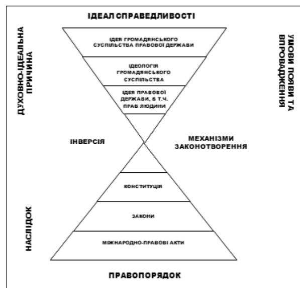
Рис. 2. Правовий ідеал, правова ідея, правова ідеологія як системна причина породжують причинно-наслідкові зв'язки та через посередність перехідно-інверсійних процесів відображаються в позитивному праві та відповідному правопорядку