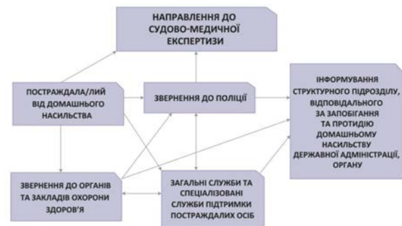
Рис. 2. Міжвідомча взаємодія між суб'єктами в разі звертання постраждалого громадянина за допомогою [8, с. 38]

До таких суб'єктів, зокрема, належить Національна поліція України – центральний орган управління, що служить суспільству шляхом забезпечення захисту прав і свобод людини, боротьби зі злочинністю та підтримання громадської безпеки і порядку [7].